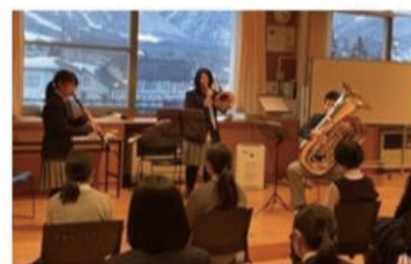
中学生との交流会