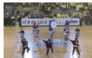
信州プレイブウォーリアーズでの演奏 (ダンス部合同)